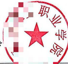
附录 1: 专业人才培养方案编制委员会